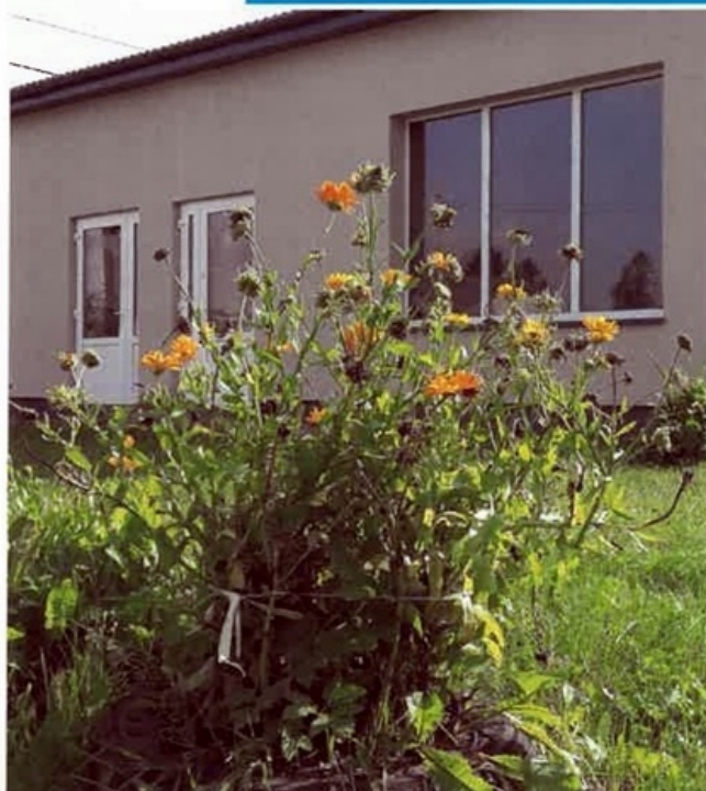
Świetlica w Wojciechowie