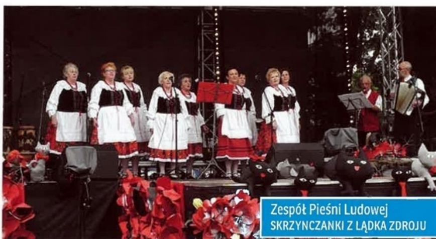
Zespół Pieśni Ludowej SKRZYNCZANKI Z ŁĄDKA ZDROJU