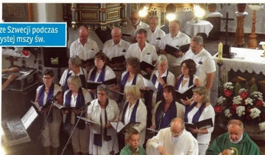
Chór ze Szwecji podczas uroczystej mszy św.