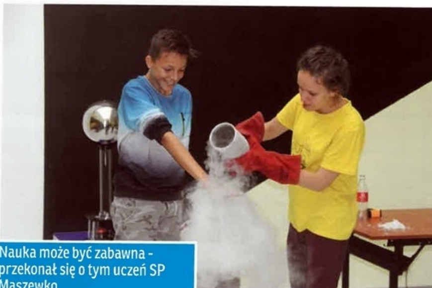
Nauka może być zabawna - przekonał się o tym uczeń SP Maszewko

Zajęcia dla gimnazjalistów zaplanowane będą w formie obozów - tzn. zajęć odbywających się w dni wolne od zajęć szkolnych podczas ferii lub wakacji - w ciągu 6 godzin. Tu uczniowie pogłębią już zdobyte umiejętności posługiwania się językiem angielskim poprzez prowadzenie zajęć w sposób pomagający przełamać barierę mówienia, z wykorzystaniem wielu cie-