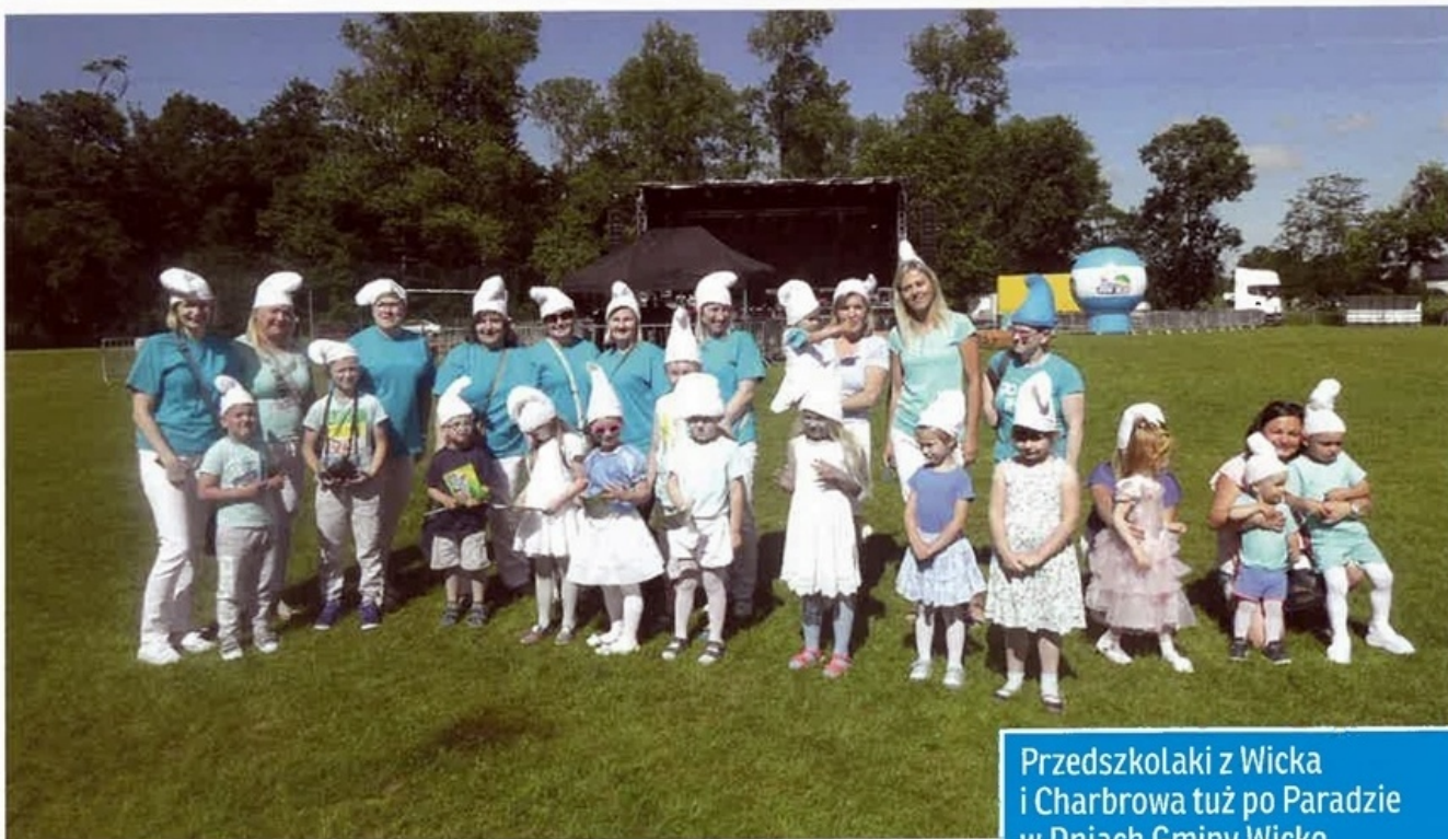
Przedszkolaki z Wicka i Charbrowa tuż po Paradzie w Dniach Gminy Wicko

W akacje już za nami. Przedszkolaki wróciły do przedszkola wypoczęte i gotowe do zabawy i nauki. W czasie letniego wypoczynku cały miesiąc lipiec przedszkolaki spędzały na rozwijaniu swoich uzdolnień, grach sportowych, poznawaniu ciekawych ludzi, odwiedzaniu miejsc, gdzie zawsze super się bawiły.