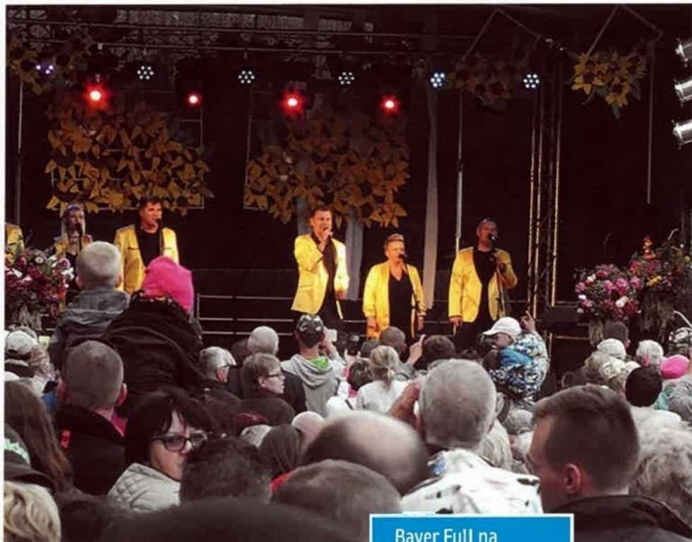
Bayer Full na scenie