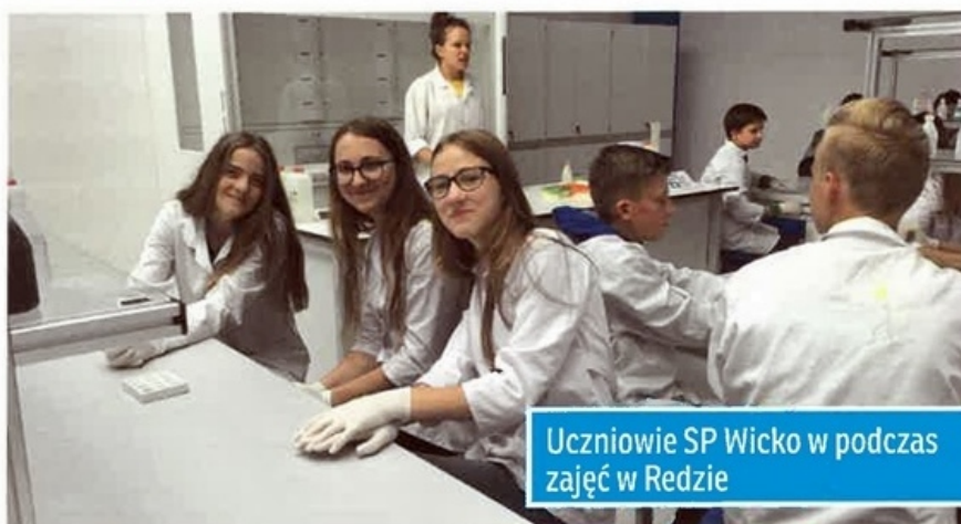
Uczniowie SP Wicko w trakcie zajęć w Redzie

Zajęcia skierowane do gimnazjalistów, są odpowiedzią na potrzeby i realne