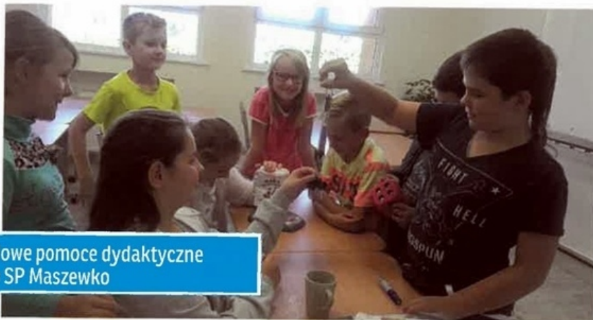
Nowe pomoce dydaktyczne w SP Maszewko

kawych materiałów autentycznych oraz najnowszych technologii ułatwiających uczenie się.