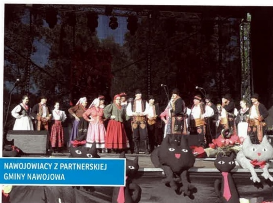
NAWOJOWIACY Z PARTNERSKIEJ GMINY NAWOJOWA