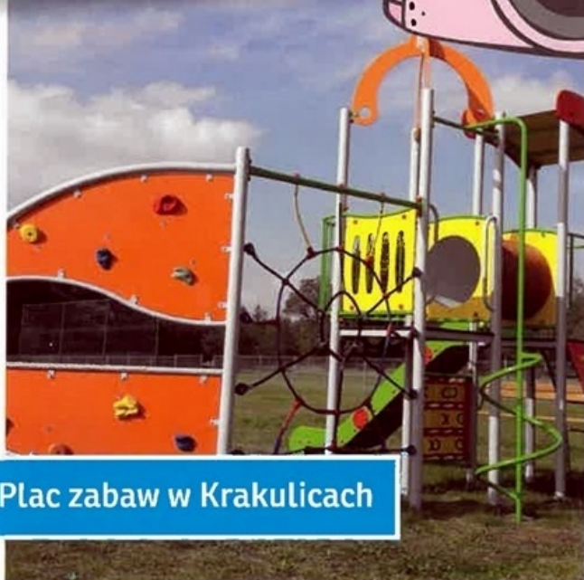
Plac zabaw w Krakulicach