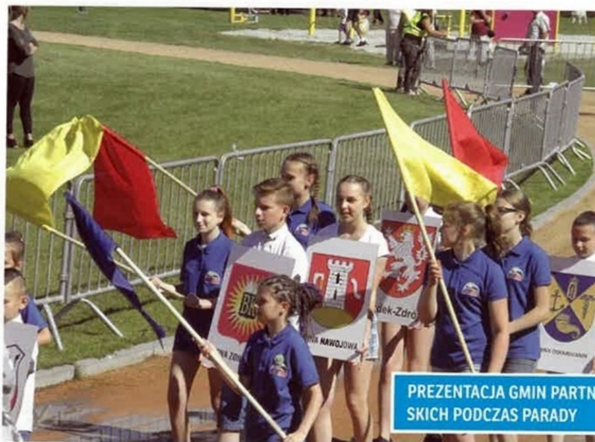
PREZENTACJA GMIN PARTNERSKICH PODCZAS PARADY