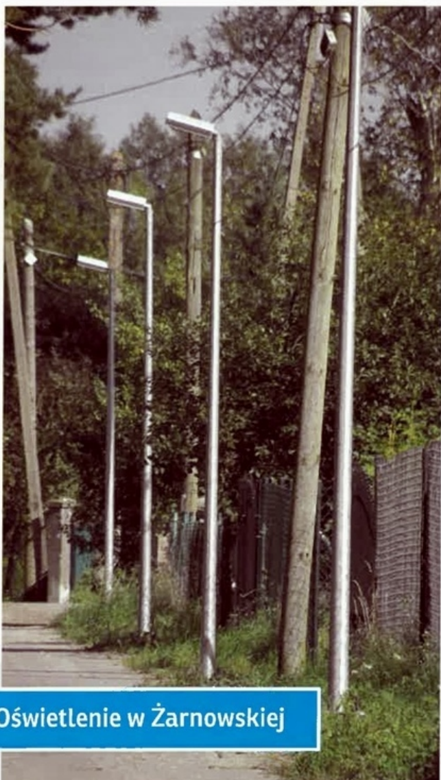
Oświetlenie w Żarnowskiej