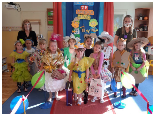
Pokaz mody ekologicznej w Przedszkolu w Charbrowie

Na pokazie można było zobaczyć strój ekologiczny sportowy, wieczorowo-wizytowy, codzienny, strój kosmonauty, robota itp. Ciekawym dodatkiem było nakrycie głowy, biżuteria i buty z surowców wtórnych. Za występ w pokazie mody ekologicznej i zaprezentowanie swojego stroju dzieci otrzymały dyplomy i nagrody.