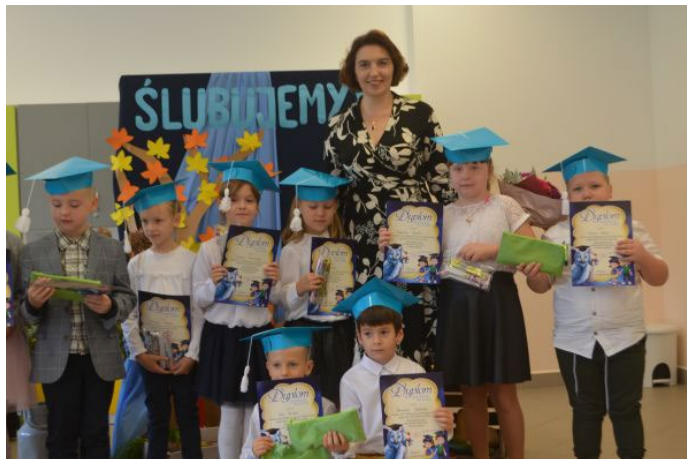
Uroczyste ślubowanie uczniów klasy I w SP Szczenurze

Niestety pandemia Covid-19 na początku roku rozszerzyła swoje horyzonty również w naszym kraju. Sytuacja zmusiła wszystkie placówki oświatowe do przejścia w tryb nauki zdalnej od dnia 11 marca. Pierwsze miesiące minęły niezwykle pracowicie. Uczniowie z naszej szkoły wsparli 28 finał WOŚP-u. Odwiedzili w styczniu pensjonariuszy DPS w Lęborku celem wspólnego kolędowania. Dzieci śpiewały pastorałki w języku polskim i kaszubskim. Włączyły się do akcji „Puszka dla głodnego brzuszka”, wspierając bezdomne zwierzęta. Uczennice z naszej szkoły wystąpiły na Festiwalu Piosenki Zimowej. W ramach współpracy ze Słowińskim Parkiem Narodowym dla wszystkich dzieci zorganizowano cykl spotkań „Moje przygody z SPN”. Uczestniczyliśmy w niezwykłym nocnym rajdzie w Słupsku „Krok po kroku bezpiecznie o zmroku”. Z kolei dla dzieci uczących się języka kaszubskiego, w nagrodę za udział w V edycji wojewódzkiego konkursu plastycznego pt. „Aktywne Kaszuby” był wyjazd na mecz siatkarki w Ergo Arenie w Gdańsku.