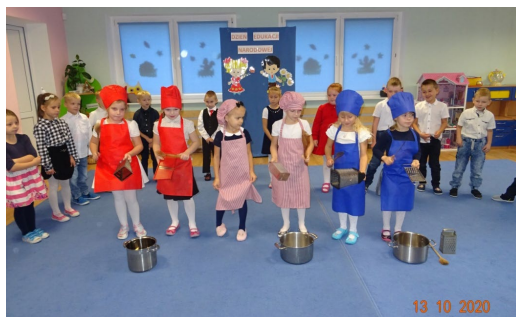
Dzień Edukacji Narodowej w Przedszkolu w Wicku