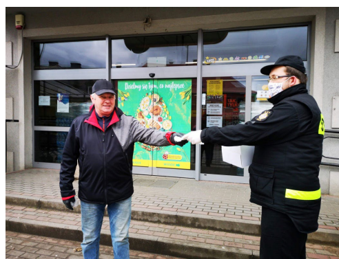
Dystrybucja maseczek przez strażaków OSP Wicko