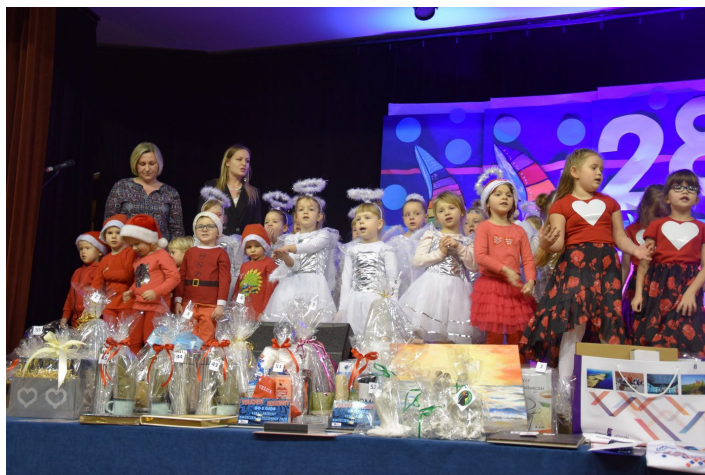
28 Finał Wielkiej Orkiestry Świątecznej Pomocy w Wicku