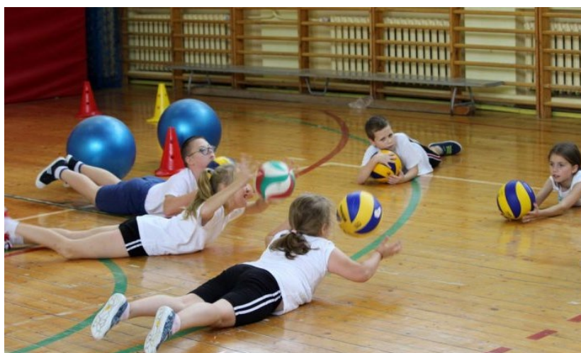
Zajęcia korekcyjne w SP Wicko

We wszystkich Szkołach Podstawowych z terenu Gminy Wicko w miesiącach wrzesień-listopad były prowadzone zajęcia sportowe z elementami gimnastyki korekcyjno-kompensacyjnej w ramach projektu pn. „Aktywność sportowa fajna sprawa ale ważna jest prosta postawa”. Zajęcia te zachęciły uczniów do regularnej aktywności fizycznej, jak również kształtowały podstawowe nawyki ruchowe związane z prawidłową postawą ciała. W projekcie uczestniczyło 70 uczniów, który został współfinansowany przez Ministerstwo Sportu i Turystyki.