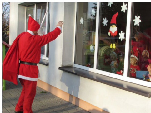
Mikołajki w Przedszkolu w Charbrowie

07.12.2020 jak co roku odwiedził nasze przedszkole Mikołaj. Odwiedził dzieci we wszystkich grupach, dziękował za laurki, zaprezentowane piosenki i wiersze. Jak przystało na prawdziwego Mikołaja obdarował przedszkolaków prezentami.