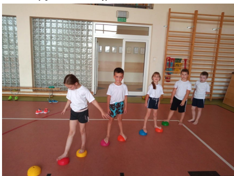
Zajęcia korekcyjne w SP Maszewko

We wszystkich Szkołach Podstawowych z terenu Gminy Wicko w miesiącach wrzesień-listopad były prowadzone zajęcia sportowe z elementami gimnastyki korekcyjno-kompensacyjnej w ramach projektu pn. „Aktywność sportowa fajna sprawa ale ważna jest prosta postawa”. Zajęcia te zachęciły uczniów do regularnej aktywności fizycznej, jak również kształtowały podstawowe nawyki ruchowe związane z prawidłową postawą ciała. W projekcie uczestniczyło 70 uczniów, który został współfinansowany przez Ministerstwo Sportu i Turystyki.