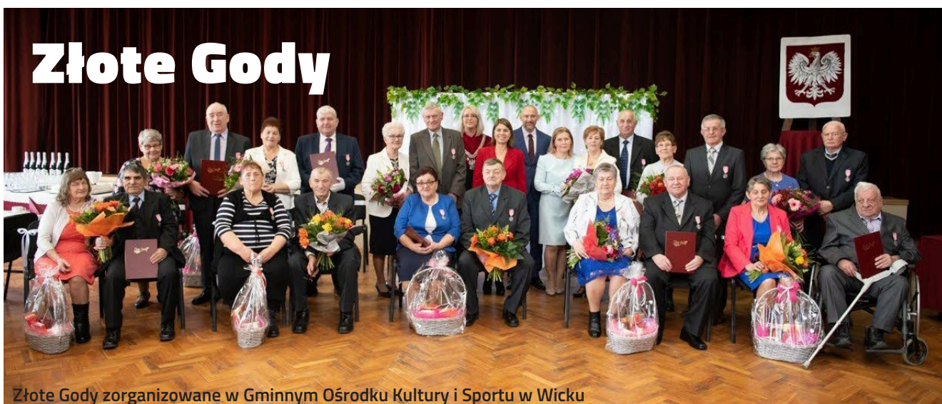
Złote Gody zorganizowane w Gminnym Ośrodku Kultury i Sportu w Wicku

4 lutego - w święto zakochanych gościliśmy 11 par z terenu Gminy Wicko, które ślubowały sobie miłość, wierność i uczciwość małżeńską 50 lat temu.