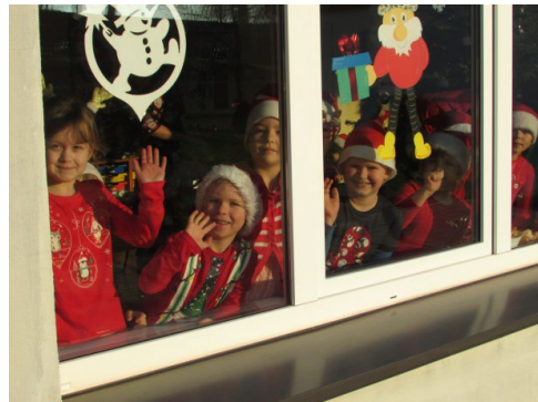
Mikołajki w Przedszkolu w Charbrowie