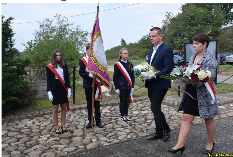
Złożenie wieńców pod pomnikiem ofiar Marszu Śmierci w Gęsi