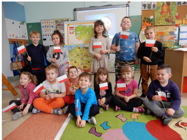
Święto odzyskania Niepodległości w SP Szczenurze