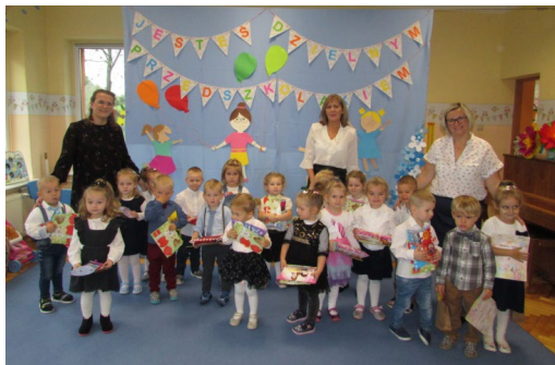
Pasowanie na Przedszkolaka