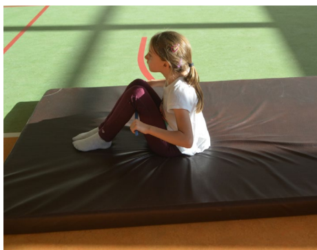
Zajęcia korekcyjne w SP Szczurze